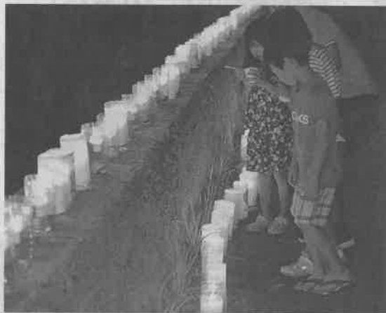
幻想的な明かりを楽しむ来場者 ―浜田市西村町で

③2)は「患者はもどかしい気持ちを抱えてい、と改めて感じた。【鈴木周】 その人に寄り添ったりハビリを心がけたい」と話した。【鈴木周】